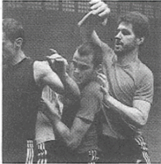
Un « match à 4 » chorégraphique

La danse fait peu à peu son nid au palais des sports. Samedi 12 avril , une journée lui sera entièrement consacrée avec des initiations gratuites au cheerleading (pom pom girl), à la capoeira, à la danse contemporaine, au hip-hop... Clou de la manifestation, un spectacle de la compagnie Naline Beaulieu mettant en scène quatre danseurs. « Cette pièce puise son inspiration dans le sport et l'univers masculin », raconte une représentante de la compagnie. « C'est à la fois physique et loufoque. Cela va rappeler à certains les années lycée ! » Ambiance gymnase garantie.